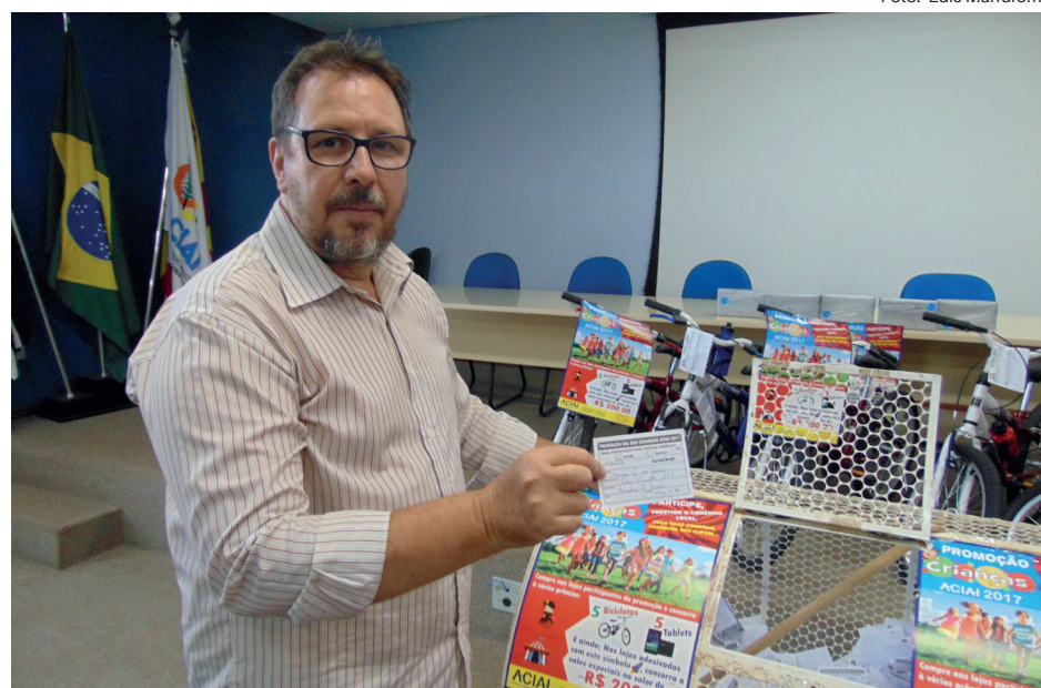
Presidente da ACIAI participa do sorteio